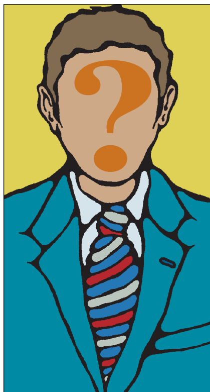
Chi sarà il nuovo presidente di Confagricoltura?

simo 28 ottobre. Sinceramente, checché ne pensi l'interessato, che molta parte del "misfatto", di stile e di sostanza, ha ereditato. Ma che noi soltanto, minoranza storica liberale capeggiata da Giulio Leopardi in Confagricoltura, per lungo tempo abbiamo contestato; ragione per la quale siamo stati sconfitti ad opera di una scelta traditrice di coloro che volevano restare su quella strada. Giulio Leopardi e il suo gruppo liberale sono stati i primi, con Francesco Petrilli (vicepresidente della Federconsorzi), a contestare un percorso iniziato nel dopoguerra, ma che doveva finire. Un malcostume che se aveva avuto una teorica giustificazione nell'epoca dell'arrembaggio dei comunisti alle nostre aziende, col passare degli anni non trovava nessuna ragione che lo giustificasse. Per restare quello che era: un danno continuato agli agricoltori d'accordo con altri.