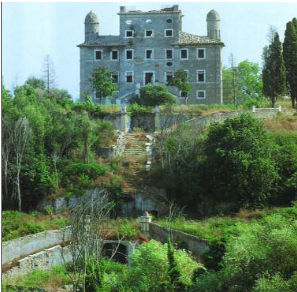
Villa York, splendido gioiello architettonico del Rinascimento purtroppo in stato di totale abbandono, è situata in piena campagna all'interno della città di Roma. È tra gli immobili di indubbio pregio di proprietà della Federconsorzi da poco dissequestrati.

N ello scorso settembre la Corte d'appello di Perugia ha depositato la motivazione della sentenza sulla vicenda Federconsorzi. Quando nello scorso giugno era uscito il dispositivo, tutta la stampa, ad una voce aveva salutato l'assoluzione di Pellegrino Capaldo (l'ex presidente della Banca di Roma) ed Ivo Greco (ex presidente della Sezione fallimentare del Tribunale di Roma ed anche, poi, del Tribunale dei Ministri) dall'accusa di bancarotta fraudolenta per dissipazione, come un gran ribaltamento delle condanne a 4 anni di reclusione fatta dal Tribunale.