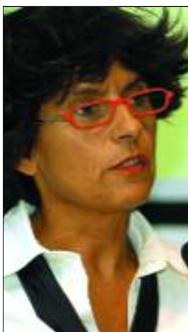
Dina Porazzini, presidente dell'Ordine Nazionale degli Agronomi.

Infatti, il ministero ha prorogato di ul-